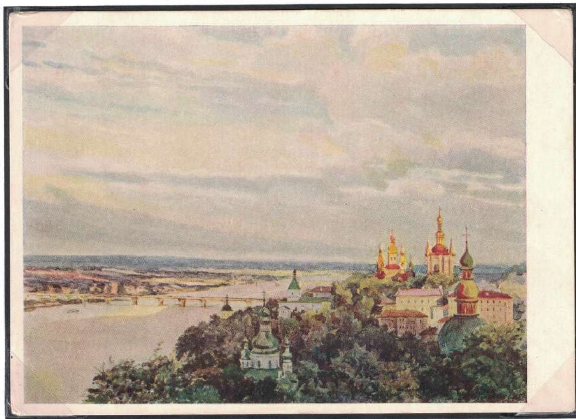
Художественная открытка «Киев на Днепре»

В течение трёх суток он обеспечивал бесперебойную корректировку арт. огня при отражении контратак врага. В рукопашной схватке уничтожил двоих гитлеровцев, не дав захватить в плен командира. В живых осталось только четверо бойцов группы, которые через трое суток соединились с частями дивизии.